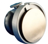
mechanische Probenhalter (rund)