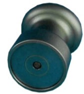
magnetischer Probenhalter (rund)